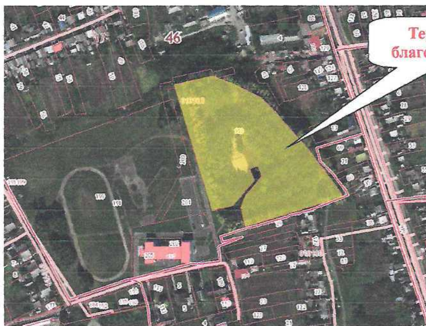
Рис.1. Общий вид территории благоустройства.

Территория, благоустройства, расположена на земельном участке с кадастровым номером 46:17:010108:193, земельный участок находится в собственности муниципального образования «поселок Прямицыно» Октябрьского района Курской области. Площадь территории благоустройства составляет 30 280 кв.м. и находится в центральной части поселка. Градостроительная особенность территории благоустройства состоит в том, что он находится, в общественно-деловой зоне, вокруг земельного участка находятся индивидуальная жилая застройка, а также общеобразовательная школа.